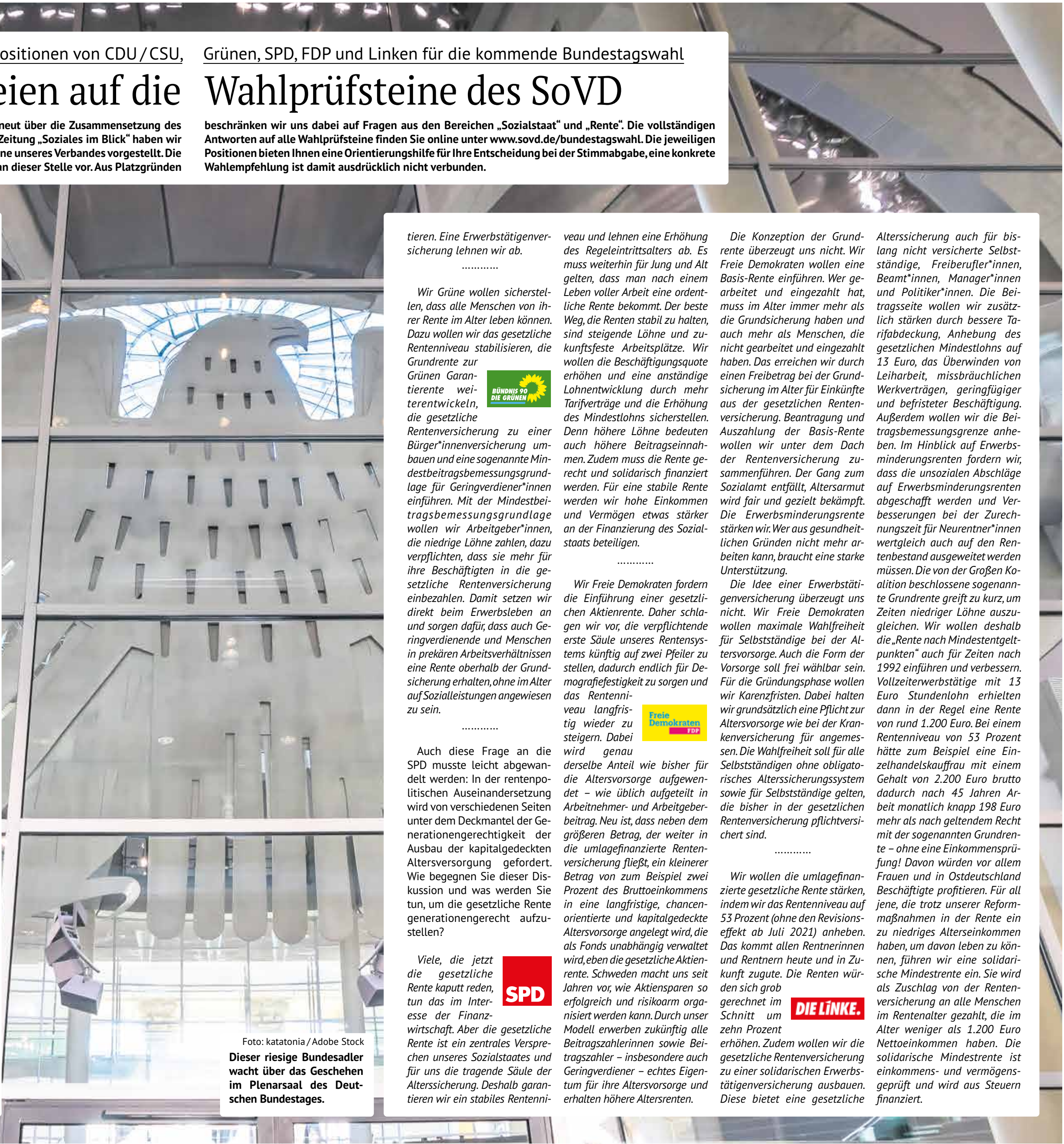
Dieser riesige Bundesadler wacht über das Geschehen im Plenarsaal des Deutschen Bundestages.