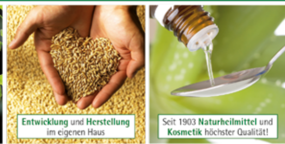
Entwicklung und Herstellung im eigenen Haus