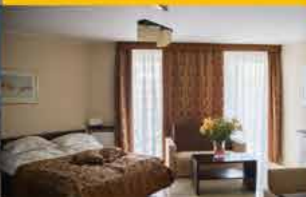
Zimmerbeispiel, 3★ Hotel Avangard Resort