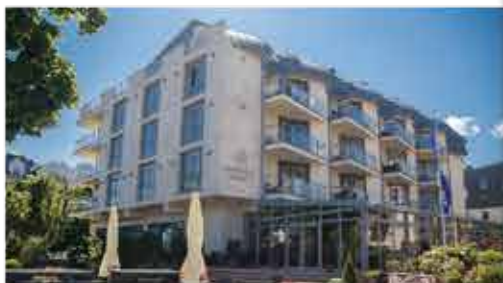
3★ Hotel Avangard Resort