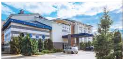
3+ Hotel Diament Spa