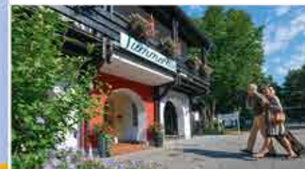
3+ Hotel Summerhof