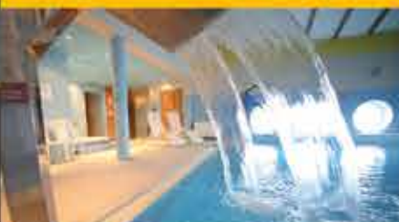
Schwimmbad, 3+ Hotel Diament Spa

Der charmante Kurort Bad Griesbach liegt inmitten des idyllischen Rottaler Bäderdreiecks – bekannt für sein umfangreiches Thermen- und Freizeitangebot.