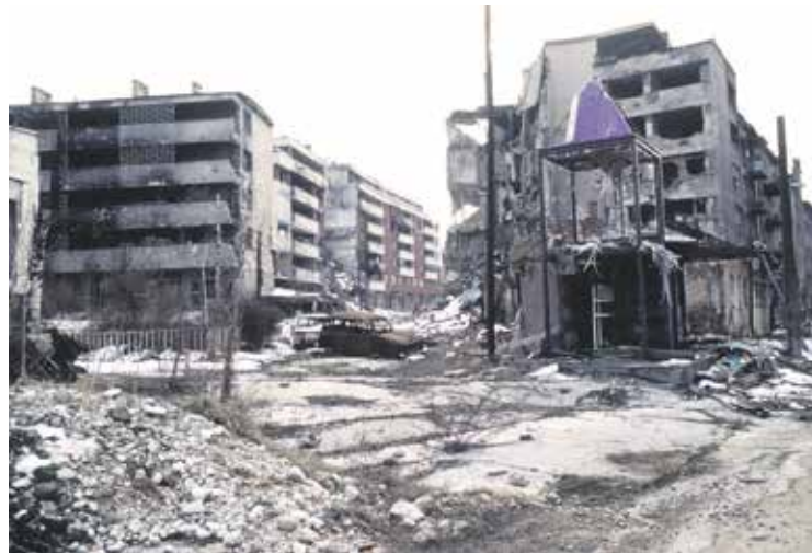
Infolge des Bosnienkrieges wurden zahlreiche Gebiete unbewohnbar, so etwa auch die Stadt Grbavica in der Nähe von Sarajevo.

Nachdem serbische Truppen die Stadt Srebrenica eingenommen hatten, erschossen sie im