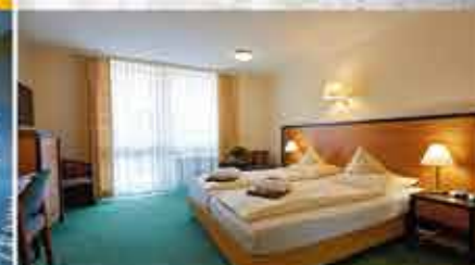
Zimmerbeispiel, 3+ Hotel Summerhof