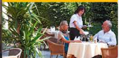
Terrasse, 3+ Hotel Summerhof

Beratung & Buchung: 0800 - 228 42 66 gebührenfrei / Mo.-Fr.: 09-17 Uhr