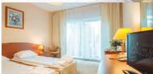
Zimmerbeispiel, 3+ Hotel Diament Spa